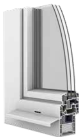
Finestra in PVC Ego®Allround