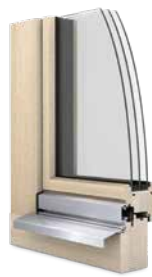
Finestra in legno Ego®Woodstar

Il reparto di ricerca e sviluppo dell'azienda garantisce un alto tasso di innovazione. In questo modo EgoKiefer è in grado di soddisfare in ogni momento le esigenze del mercato: sia che si tratti di finestre o porte, sia in termini di estetica che di funzione.