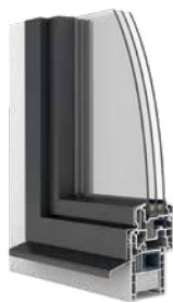
Finestra in legno/PVC Ego®Allround