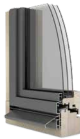
Finestra in legno/alluminio Ego®Allstar